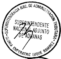
NAHIL LILIANA HIRSH CARRILLO Superintendente Nacional SUPERINTENDENCIA NACIONAL DE ADMINISTRACIÓN TRIBUTARIA