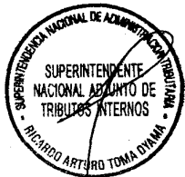
NAHIL LILIANA HIRSH CARRILLO Superintendente Nacional SUPERINTENDENCIA NACIONAL DE ADMINISTRACION TRIBUTARIA