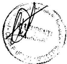
NA LIANA HIRSH CARRILLO Superintendente Nacional SUPERINTENDENCIA NACIONAL DE ADMINISTRACION TRIBUTARIA