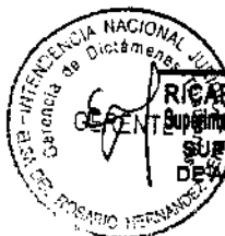
RICARDO ARTURO TOMA OYAMA Superintendente Nacional Adjunto de Tributos Internos SUPERINTENDENCIA NACIONAL DE ADMINISTRACION TRIBUTARIA